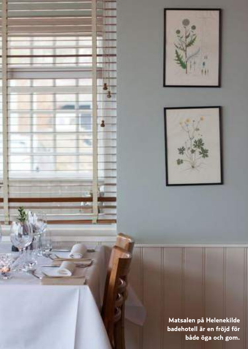
Matsalen på Helenekilde badehotell är en fröjd för både öga och gom.